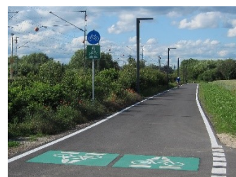
Radschnellweg Darmstadt – Frankfurt; Bild: wikipedia

Dieses Programm wird in den nächsten Jahren massiv aufgestockt, die Bundesmittel für „aktive Mobilität“ werden verzehnfacht. Damit ist auch ein Quantensprung bei der Infrastruktur finanzierbar: Ziel sind sogenannte Rad-Highways, die Kernstädte mit dem Umland möglichst direkt und kreuzungsfrei verbinden. Beispiele dafür finden sich in Kopenhagen, Amsterdam oder auch in deutschen Ballungsräumen.